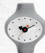
OROLOGIO in ceramica George Nelson, 1953 [Vitra].