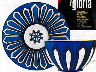
TAZZA E PIATTINO in ceramica Bleus d'Ailleurs [Hermès].