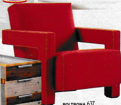
POLTRONA 637 Utrecht di Gerrit T. Rietveld, disegnata nel 1935 [Cassina].

CASSETTIERA in legno riciclato del designer olandese Piet Hein Eek [pietheineek.nl].