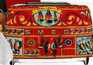
TOSTAPANE 'Sicily is my love' by Dolce&Gabbana, 2018 [Smeg].