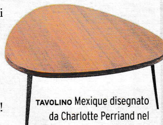
TAVOLINO Mexique disegnato da Charlotte Perriand nel 1952-'56 [Cassina].